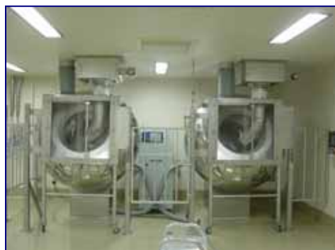
糖衣機 パン型糖衣機。錠剤の糖衣に。