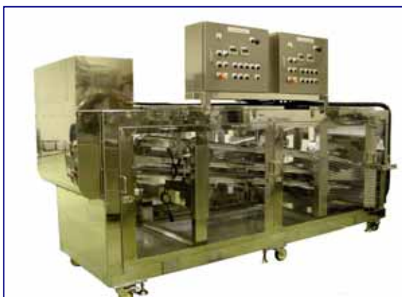
エージング装置 食品、医薬品 化成品等 (冷風・常温・温風)

乾燥技術・熱処理技術を基盤とした製造装置や設備を計画し、最適で効率の良いシステムを提案、提供いたします。