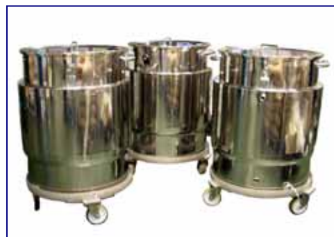
溶液タンク 各種食品、医薬品、化成品等に 攪拌機付タンク、溶解槽などや、 温・冷水温調タンクなども