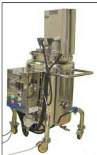
100L溶解タンク 各種食品、医薬品、化成品等に 攪拌機付タンク、溶解槽などや、 温・冷水温調タンクなども