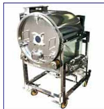
通気型回転乾燥機 カット野菜や粒状・フレーク状 の食品、医薬品、化成品等