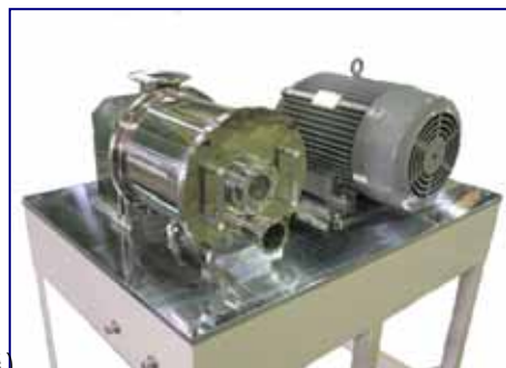
ギャザーミル (軸流気流粉碎機)