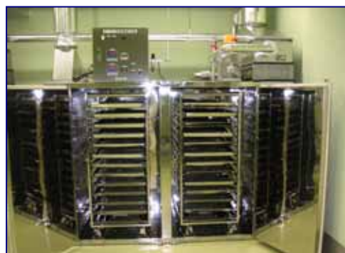
台車式箱型乾燥機 カット野菜やきのご類等の食品、 医薬品、薬草、化成品、工業材料 など、各種の乾燥に (平行流式・通気式)