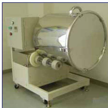
混合機(容器回転式) 各種粉体の混合や 添加作業に